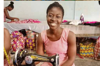
Angehende Schneiderinnen im Ausbildungszentrum GEP - Portia im eigenen Shop