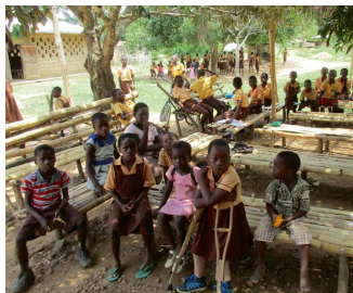
Schulkinder in Nobi, einem kleinen Buschdorf

Im Schulkinderprojekt werden rund 60 Kinder im Alter von 3 bis 19 Jahren in ihrer Schulbildung unterstützt. Dieses Projekt ist gemeindebasiert, d.h. die Kinder werden in ihrem familiären Umfeld gefördert.